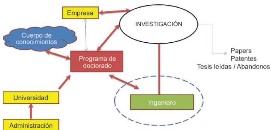
Figura 1: Agentes que intervienen en el sistema investigador y doctoral.

De forma comparada nuestra producción de ingenieros es satisfactoria. En cambio no lo es el número de tesis leídas en Ingeniería que presenta cifras muy por debajo de Estados Unidos, Alemania, Reino Unido, Francia y de la media de la Unión Europea, por citar algunos de nuestros referentes.